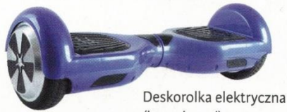
Deskorolka elektryczna (hoverboard)

Urządzenia transportu osobistego, podobnie jak hulajnogi elektryczne, są wyposażone w silnik elektryczny i nie mają siodełka. Kieruje się nimi zawsze w pozycji stojącej.